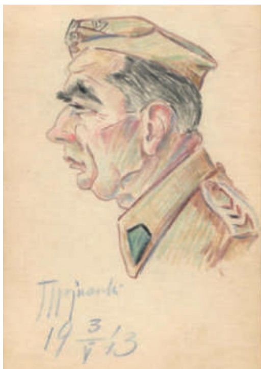
Il. 10. Starszy Sierżant , 1943; kredki, papier; 8,8 x 12,5 cm