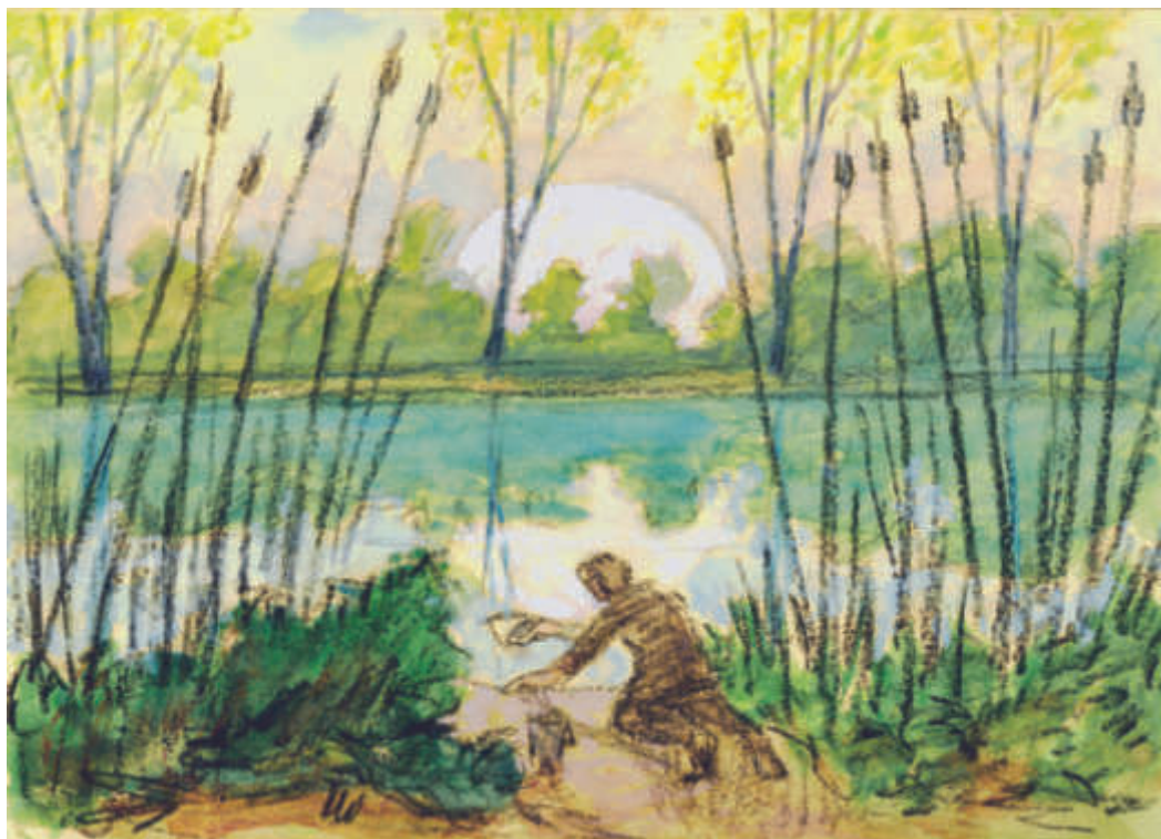
Il. 5. Iwciel. Nosiwoda , [1991]; gwasz, węgiel, papier; 20,6 x 29,5 cm