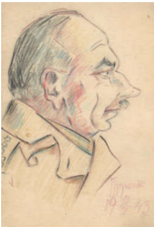
Il. 7. Porucznik , 1943; kredki, papier; 8,8 x 12,5 cm