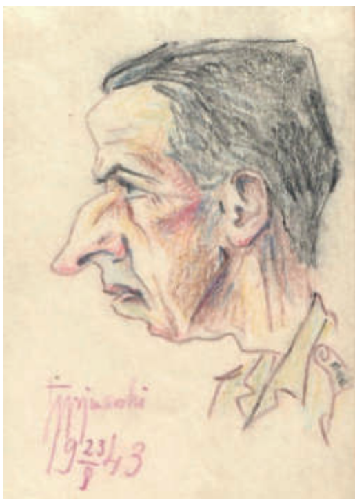
Il. 9. Kapitan , 1943; kredki, papier; 8,8 x 12,5 cm