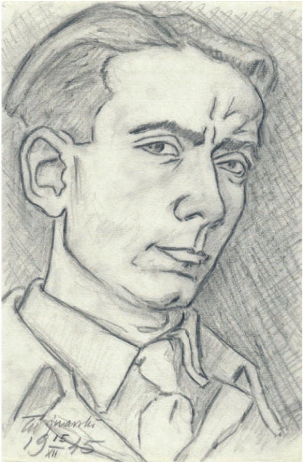
Il. 46. Autoportret , 1945; ołówek, papier; 31,7 x 21,2 cm