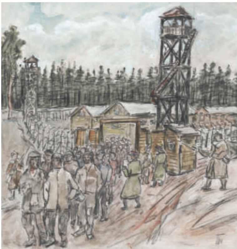
Il. 3. Iwdiel. Brama obozu , [1991]; gwasz, węgiel, papier; 35 x 34 cm