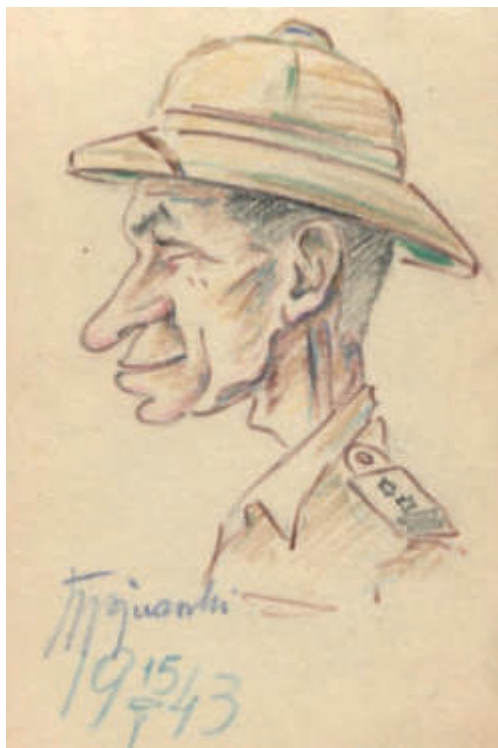
Il. 8. Podporucznik , 1943; kredki, papier; 8,8 x 12,5 cm