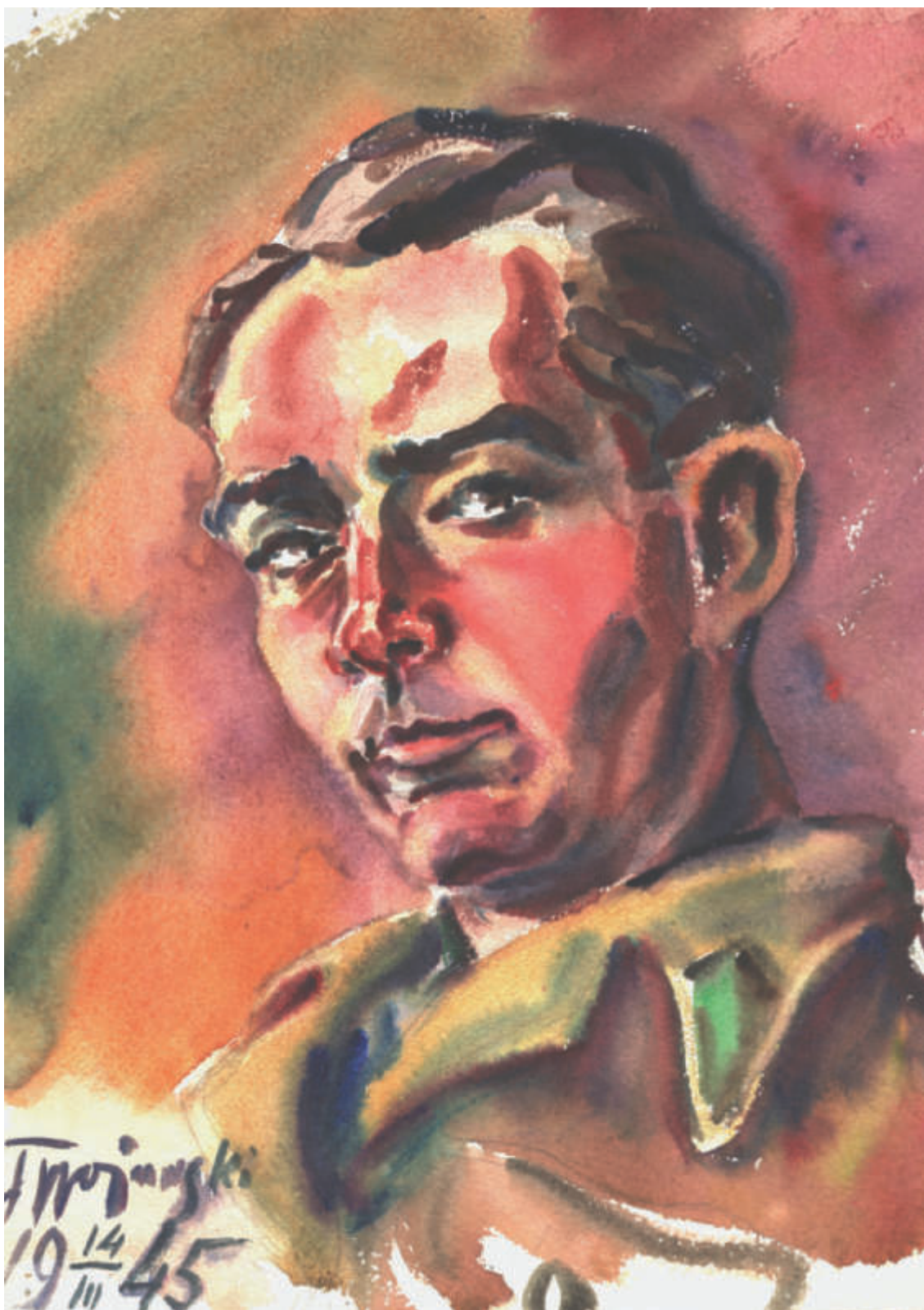
Il. 36. Autoportret , 1945; akwarela, papier; 30,8 x 22 cm