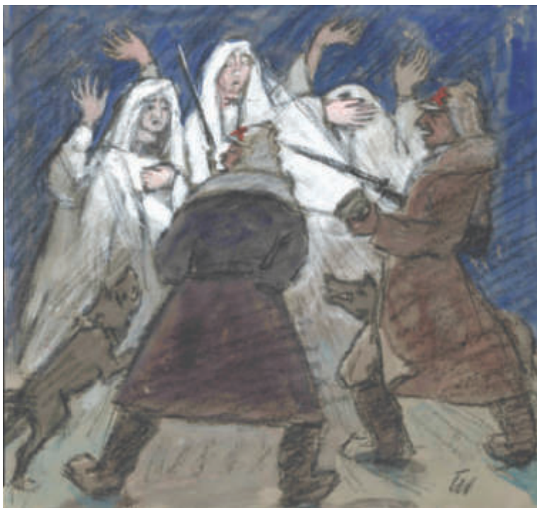
Il. 2. Przemyśl. Aresztowanie na rzece San , [1991]; gwasz, węgiel, papier; 28 x 29,5 cm