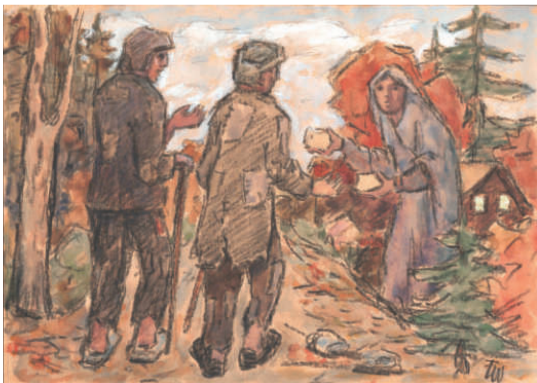
Il. 6. Iwciel. Miłosierdzie , [1991]; gwasz, węgiel, papier; 20,6 x 29,5 cm